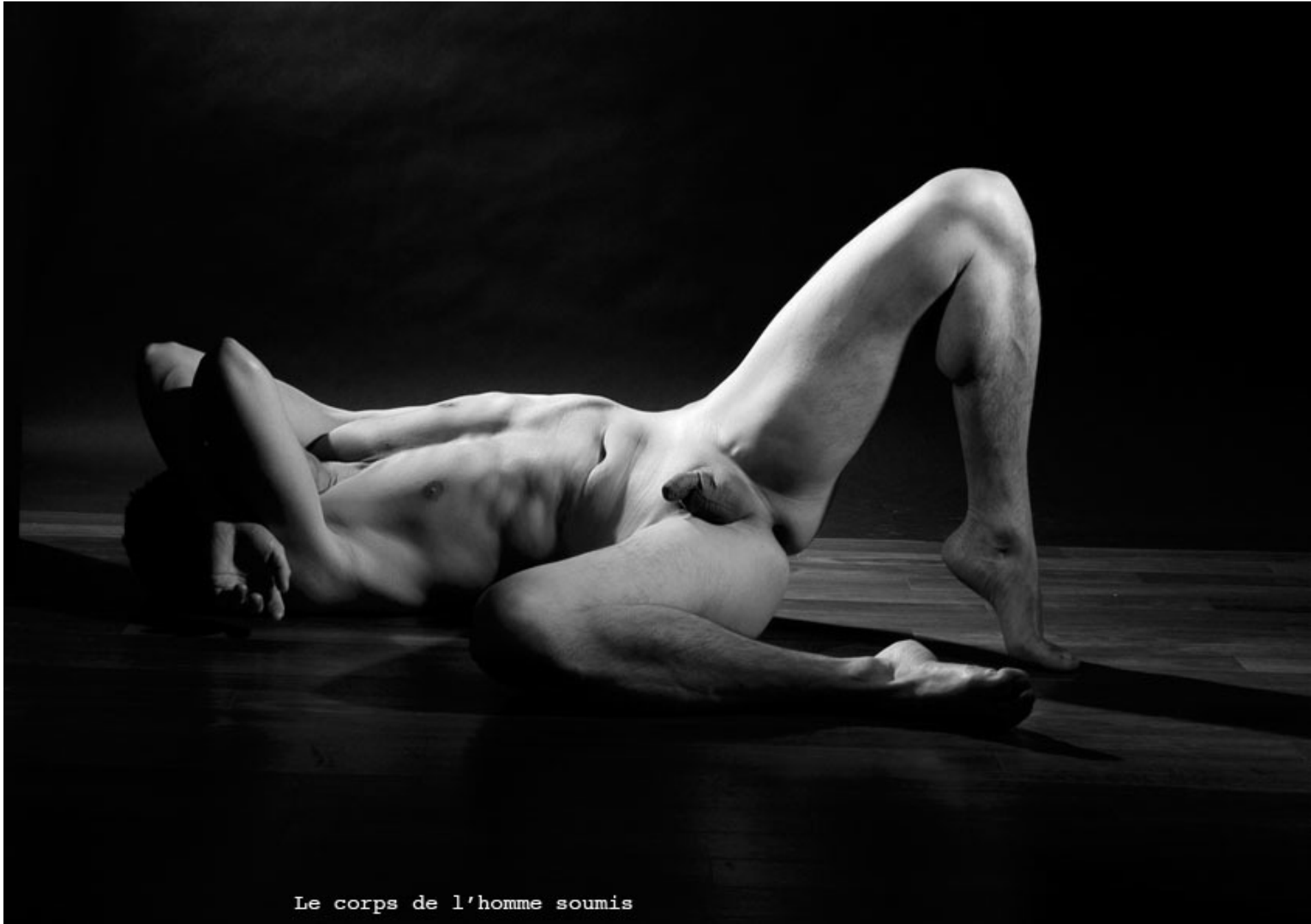
Le corps de l'homme soumis